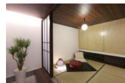
Japanese-style room 和室と縁 和室につながる縁側は遊べる人の気持ちをはかせるような癒しの場所。