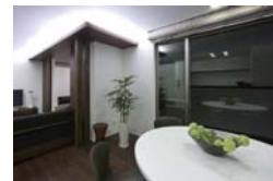
Dining room ダイニング 大きな窓に面したダイニングは食事しながら外の眺めを楽しめる。