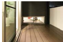
Wooden terrace ウッドテラス のんびりと出来る開放的な空間。さまざまな用途に利用できる活用性も。