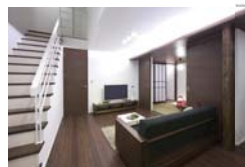
Living リビング リビングアップ階段のあるリビングは家族とのコミュニケーションの場に最適。