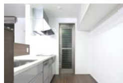
Kitchen キッチン 広々とした対面式のキッチン。料理を作りながら家族との会話も弾む。