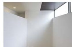
Well 吹き抜け 開放感の溢れる吹き抜けから明るい自然光が差し込む。