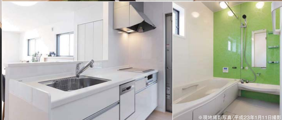
※現地撮影写真(平成23年1月11日撮影)